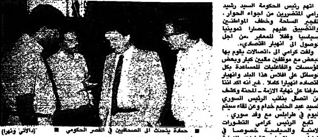
حصة يمشك في الصحافيين في قصر الحكومي (الاطال وتلورا)

اتهم رئيس الحكومة السيد رشيد كرامي المتضربين من اجواء الحوار، بتفجير الساححة وحطف المواطنين والتضييق عليهم حصارا ترموينا وسياسيا وقفا للمعابر من اجل الوصول الى انهيار الاقتصادي. ولفت كرامي الى الاتصالات يقوم بها البعض مع موظفين مابين كبار وبعض المؤسسات والفاعليات المساعدة بكل الوسائل على افلاس هذا البلد وانها التصايد انهيارا عملا، غير انه أكد اننا شرفنا في نهاية الازمة - الممثلة وعرض عن اتصال نائب الرئيس السوري السيد عبد الحليم خدام وعن لقاء سيد اليوم في طرابلس مع وفد سوري تابع الرئيس كرامي التطورات الاسنية والسليسة خصوصا في طرابلس، واتصل بلفقيات الاسنية مشددا على ضرورة وقف اطلاق النار. وتلقى اتصالا من وزير التربية والعمل الرئيس سليم الحص وعرض معه التطورات والازمة الترمونية. وتلقى اتصالا مع امين من وزير الدولة لشؤون الجنوب والاعمال الخبيث نبيه بري واستقبل وفد لجنة التنسيق الاسنية لبيروت الغربية وعرض معه الوضع في بيروت.